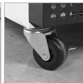
Roulettes solides en