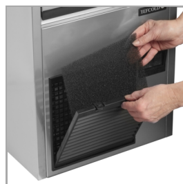
Filtre de condenseur facile à nettoyer