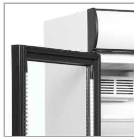
Éclairage LED dans le cadre de la porte

La gamme CEV est disponible en blanc ou en noir, avec ouverture à droite ou à gauche, et avec ou sans caisson. Sur demande et pour un léger surcoût, ce produit est également disponible en classe énergétique C. N'hésitez pas à contacter notre équipe commerciale pour plus de détails.