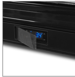
Protection de thermostat