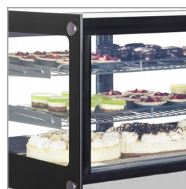
Présentoir à pâtisserie