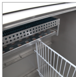
Système de cloisons