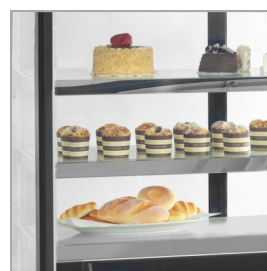
Présentoir à pâtisserie