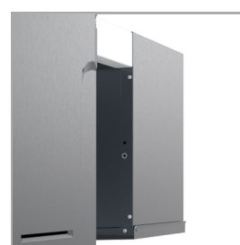
Arrière monobloc - sans panneau fixé