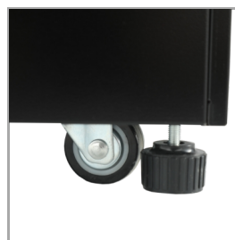
Roulettes et pieds verrouillables