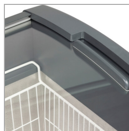
Couvertres coulissants incurvés sans cadre