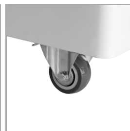
Roulettes avec et sans frein