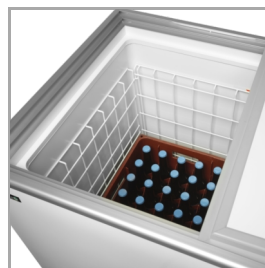
Convient aux caisses de bière et de boissons non alcoolisées