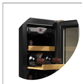
Tablettes à tiroir en bois