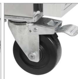
Roulettes solides en option