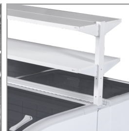
Tablettes promotionnelles en accessoire