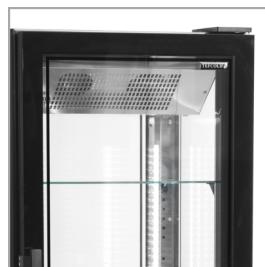
Porte sans cadre