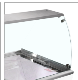
Vitrine bombée pour une meilleure présentation