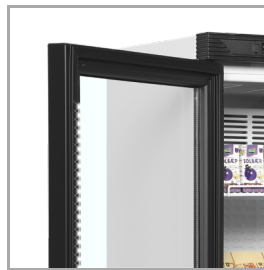
Éclairage LED dans le cadre de la porte

La gamme CEV est disponible en blanc ou en noir, avec ouverture à droite ou à gauche, et avec ou sans caisson. Sur demande et pour un léger surcoût, ce produit est également disponible en classe énergétique C. N'hésitez pas à contacter notre équipe commerciale pour plus de détails.