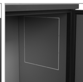
Prédécoupes pour groupe compresseur